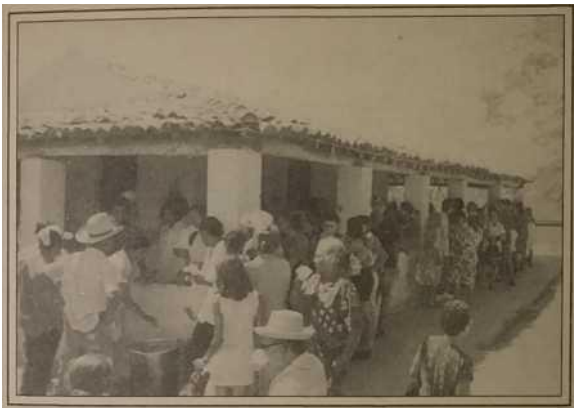
Fachada do Centro Espírita "Casa de Todos", Colônia dos Caiocas, município de Sobral – Ceará