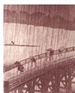
(2) Kioto, antiga capital do Japão.

Pedir-lhe perdão pela minha atitude agressiva e imperdoável, foi tudo o que pude fazer em nosso reencontro, mas, ali mesmo, ante os céus de Kioto (2) implorei aos nossos antepassados me doassem, um dia, a mesma sentença ao seu lado, de modo a me sentir exonerado do arrependimento que me feria todas as fibras do espírito.