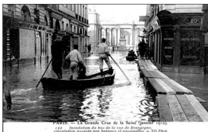
PARIS. — La Grande Crue de la Seine (janvier 1910). 1/24. Inondation du bas de la rue de Bourgogne. circulation assurée par bateaux et passerelles. — XI. Photo.

Tal tragédia natural era fruto da grande atividade industrial da região que já começava naquela época a colocar em risco o equilíbrio ecológico. A natureza dava suas primeiras respostas à ganância humana.