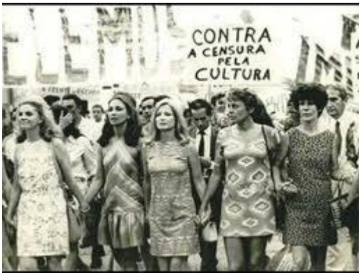
(Manifestação contra a ditadura em 1977)

Ao quarto dia do mês de janeiro de 1977, o Brasil estava sob Regime Militar tendo como presidente Ernesto Beckmann Geisel que iniciou a abertura política do país que vivera sob rígida ditadura. Geisel afirmava que o Brasil necessitava de uma redemocratização, lenta, gradual e segura.