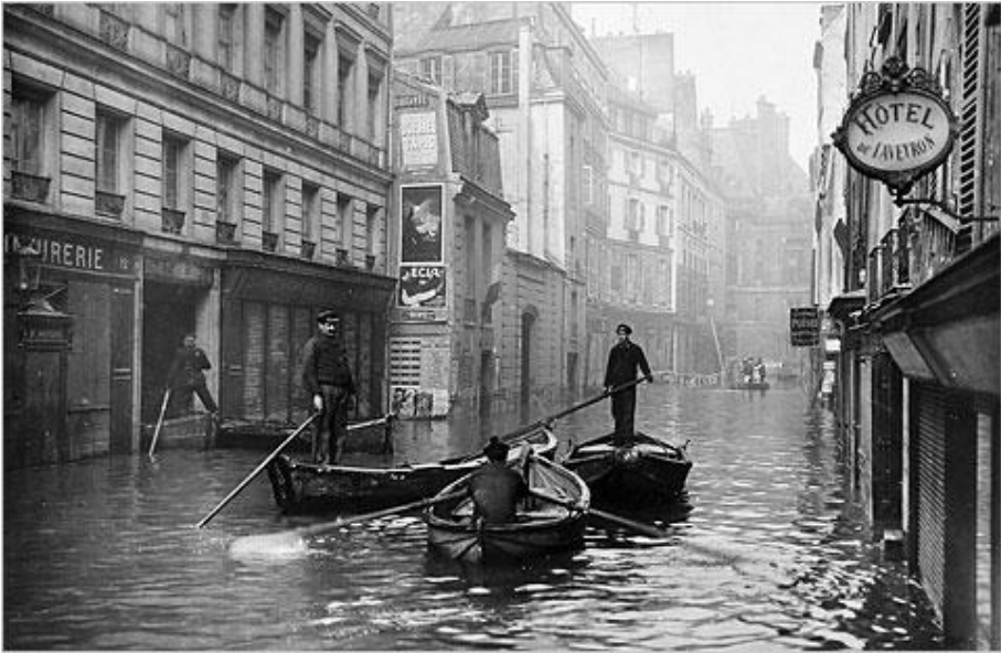
(La Crue de Paris – 1910)

O nível do rio Sena subiu oito metros e meio, inundando grande parte da cidade de Paris e arredores. Era La Crue de Paris , a maior enchente que a cidade sofrera desde 1658.