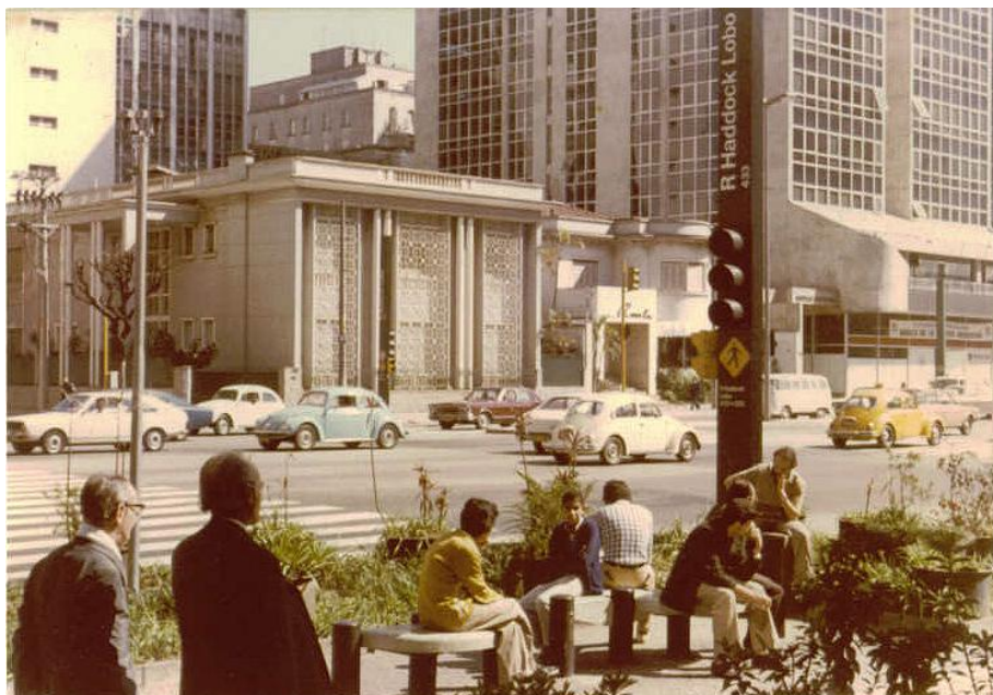
(Avenida Paulista em 1977)