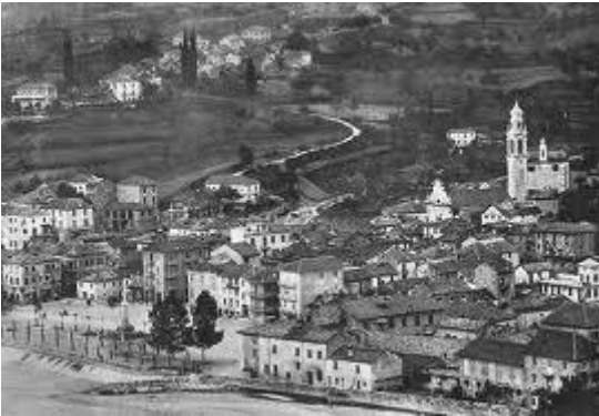
(Verona – Itália em 1955)