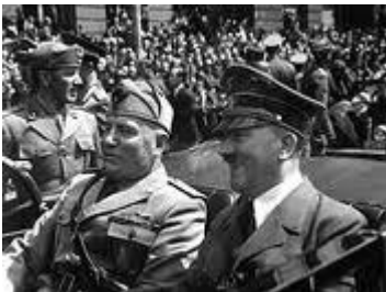
(Hitler e Mussolini em 1939)

Hitler não iniciou a guerra sozinho, seus ideais nacionalistas fascistas encontraram grandes aliados na Itália, cujo líder Mussolini compartilhava das mesmas ambições do líder alemão. Hitler também se aliou inicialmente à União Soviética e pouco mais tarde com o Japão formando então um grupo de países chamado de Eixo.