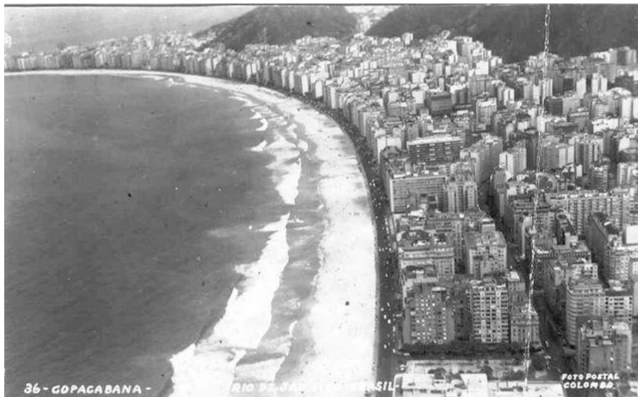
(Rio de Janeiro 1955 – Copacabana)