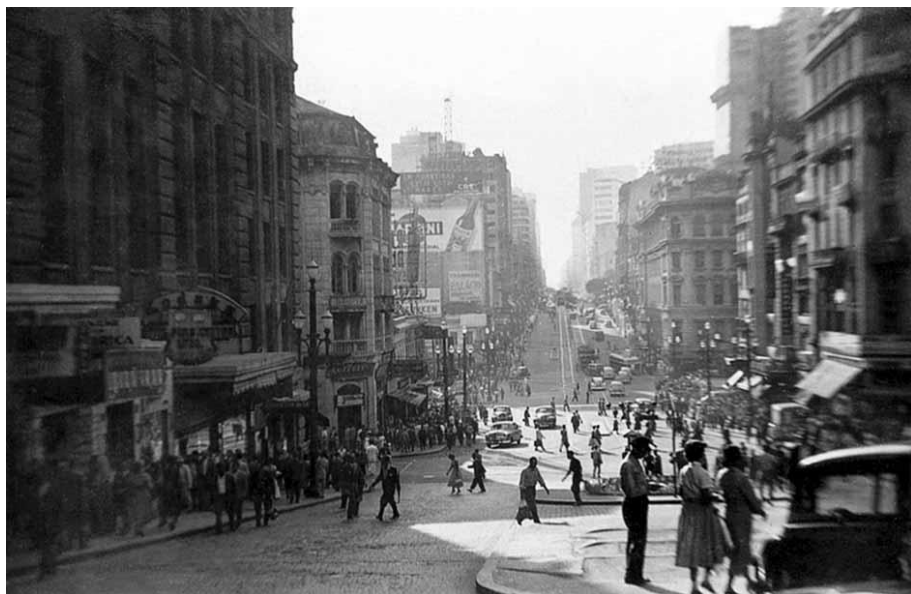
(São Paulo em 1955 – Av. São João)