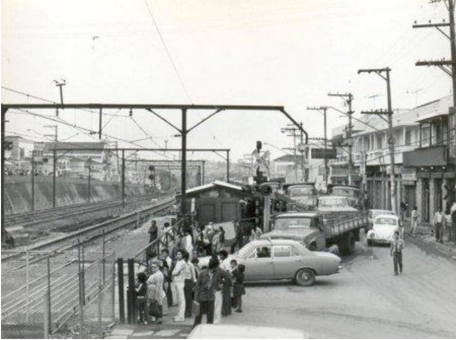
(Centro Comercial de Guaianases em 1977)

A grande maioria dos habitantes do bairro era de nordestinos recém-chegados de seus estados de origem, que vinham para a cidade de São Paulo com suas trouxas cheias de sonhos.