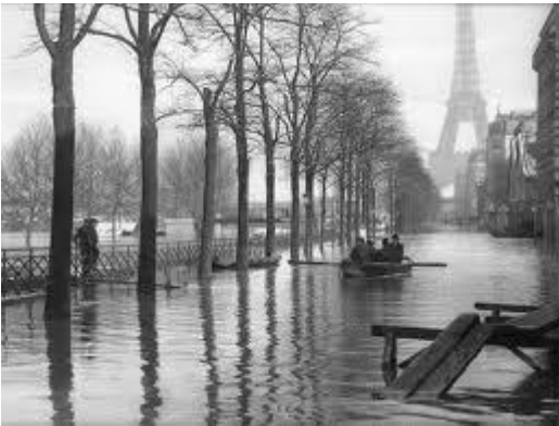
(Avenida Champs-élysées cheia em 1910)

O nível do rio Sena subiu oito metros e meio, inundando grande parte da cidade de Paris e arredores. Era La Crue de Paris , a maior enchente que a cidade sofrera desde 1658.