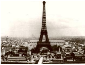
(Paris em 1910)

No início do século XX a França estava em plena Belle Époque , período de grande crescimento político, econômico e cultural, contando com a melhor tecnologia existente como uma extensa rede ferroviária, telefone, telégrafo sem fio, bem como grande industrialização.