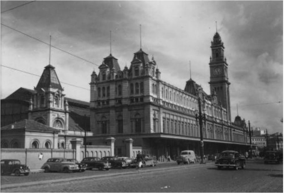
(São Paulo em 1955 – Estação da Luz)