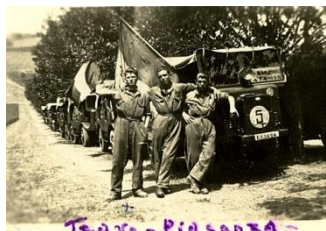
(Soldados Franceses na Itália)

A França, país vitorioso na Primeira Guerra Mundial, se alinhou com os países Aliados e em 03 de setembro de 1939 em resposta ao desrespeito dos alemães pelo Tratado de Versailles e invasão da Polônia, declarou guerra contra a Alemanha e Itália.