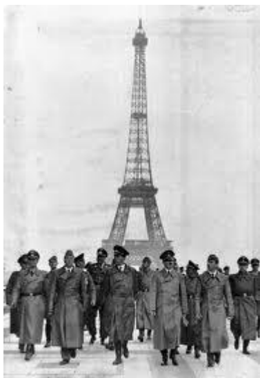
(Ilustração de Hitler e seus comandantes)