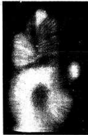
Pl. 3. — Radiographie de la main de Mme X...