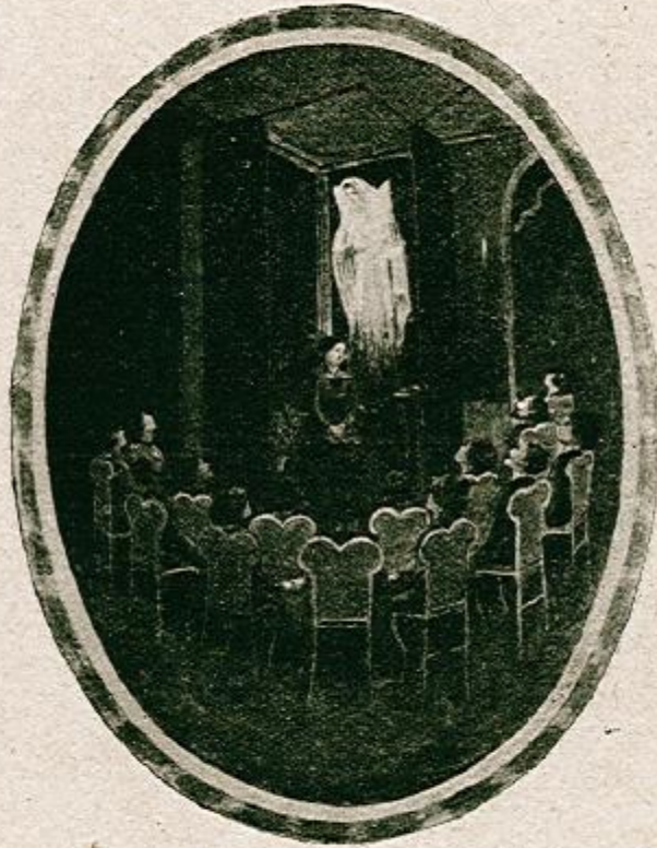
Manifestation partielle de la Religieuse, au début de ses apparitions