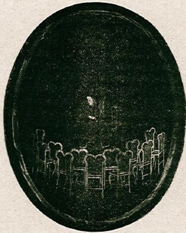
Exemple d'installation d'un cabinet spirite