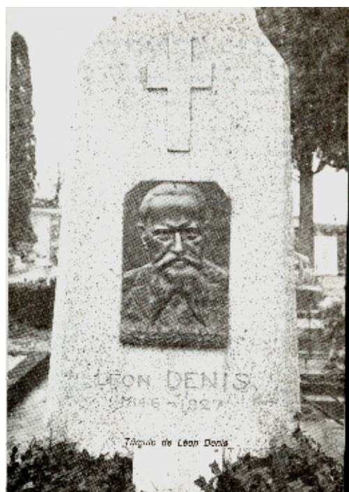
Túmulo de Leon Denis