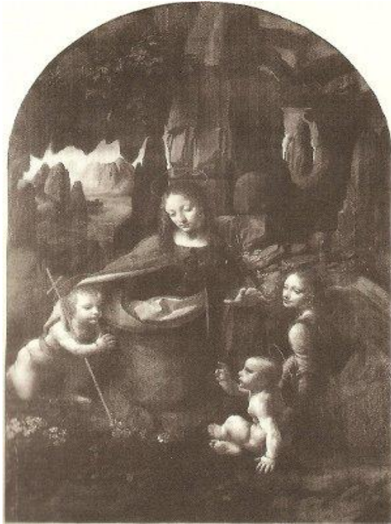
Leonardo da Vinci. A Virgem das Pedras . 1506-1508.