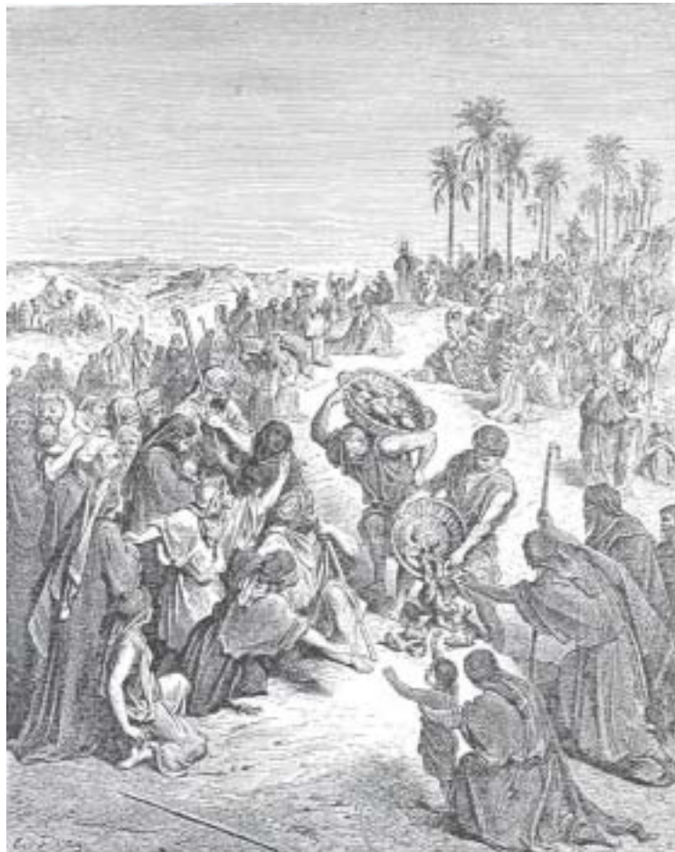
Figura “SEGUNDA MULTIPLICAÇÃO DOS PÃES”

Tendo-se realizado o prodígio entre não-judeus, observamos que não houve nenhum movimento para colocar uma coroa real na cabeça do taumaturgo.