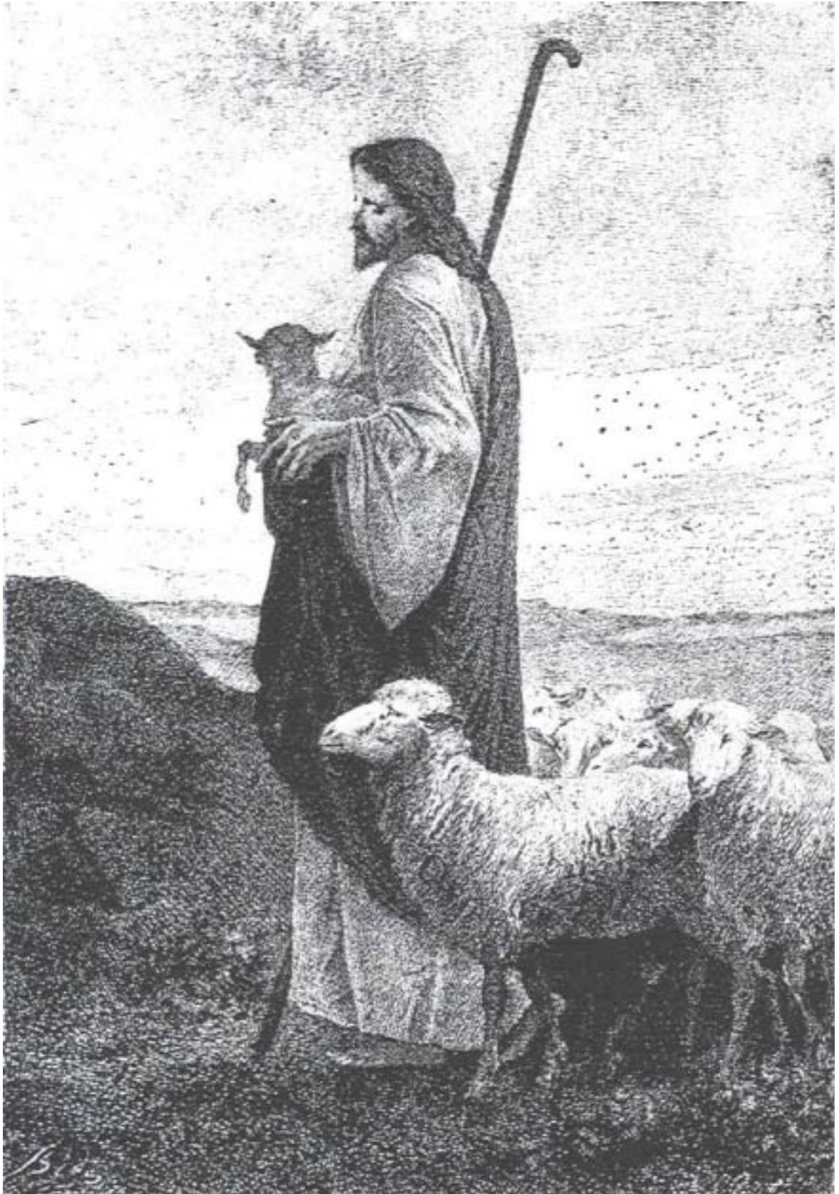
Figura “O BOM PASTOR”