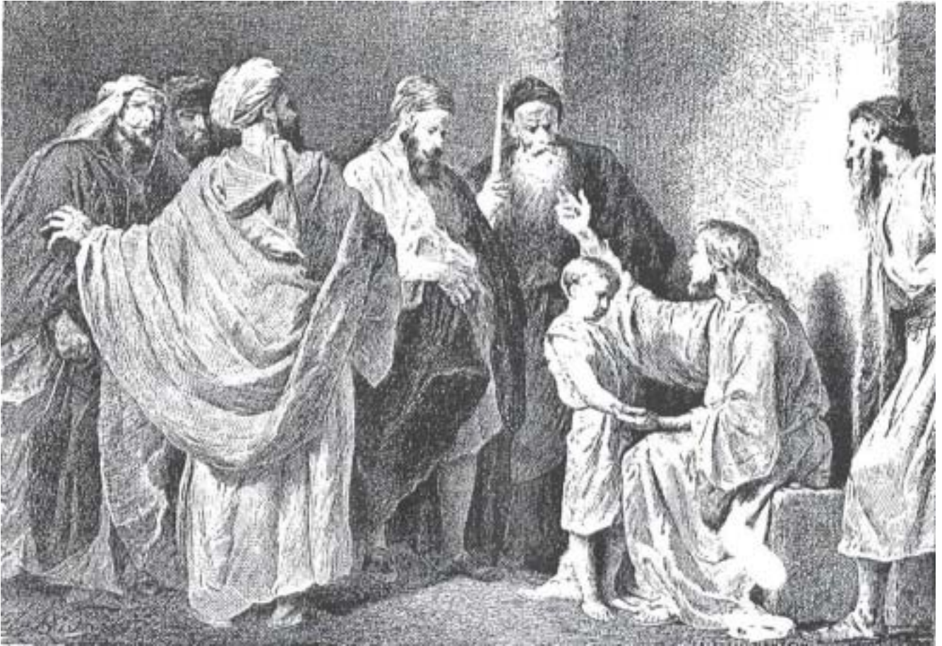
Figura "CONSELHOS AOS DISCÍPULOS"